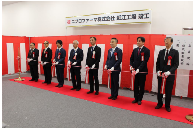
▲テープカットの様子

今回竣工を迎えた近江工場の第1期抗菌薬エリアは、セフェム系抗菌薬の製剤を生産する工場であり、2024年の出荷開始に向けて操業を開始いたします。本製剤棟は、経済産業省の「サプライチェーン対策のための国内投資促進補助金事業」に採択された年間800万袋の抗菌薬製剤ダブルバッグを生産する能力を保有する工場となります。また、製造棟には免震装置を備え付けており、地震が発生した際にも影響を受けにくいため、医薬品の製造を安定的・継続的に行うことが可能です。