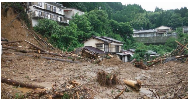
大分県日田市は市全体が山に囲まれており土砂崩れなどが頻発している。今回の実証地である日田市中津江村では、2020年7月の豪雨で孤立集落も発生している。