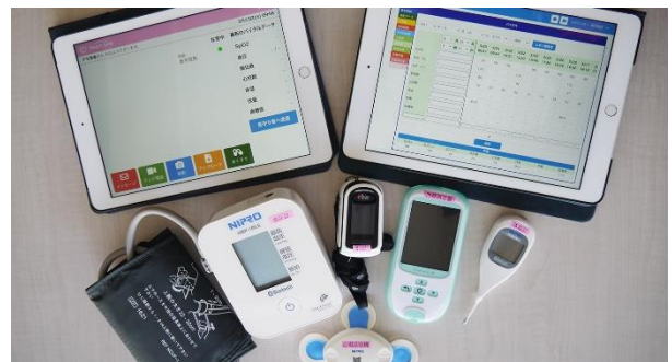
今回運搬したニプロ株式会社製の「ニプロハートライン™」。遠隔診療を実現するためのソリューションであり、タブレットで医師と通話しながら、同梱の体温計や血圧計で体調を診断することが出来る。