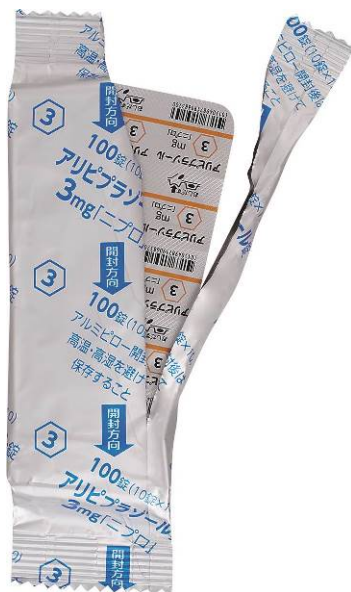
(例)アリピプラゾール錠 3mg「ニプロ」